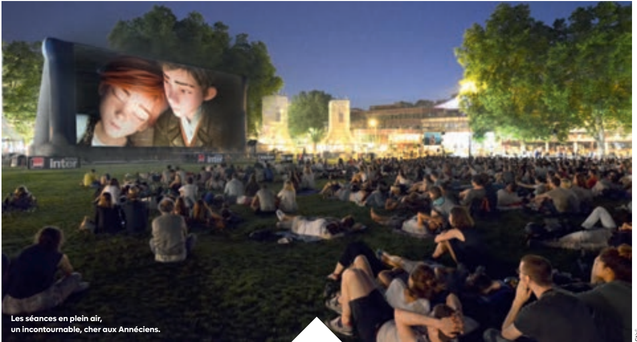
Les séances en plein air, un incontournable, cher aux Annéciens.