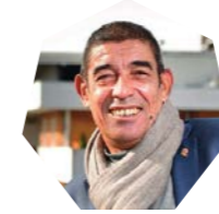
FRANÇOIS ASTORG maire d'Annecy