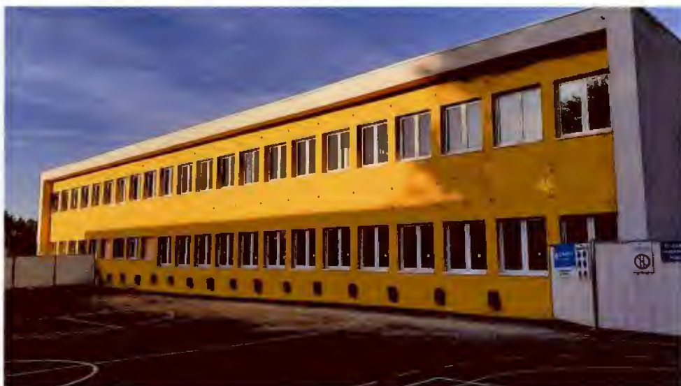
Façade EST COTFA 1