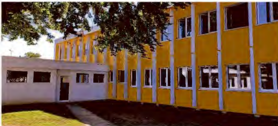
Façade EST COTFA 2