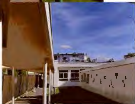
Coursive groupe scolaire Avant / Après