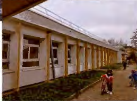
Façade OUEST Maternelle Avant / Après