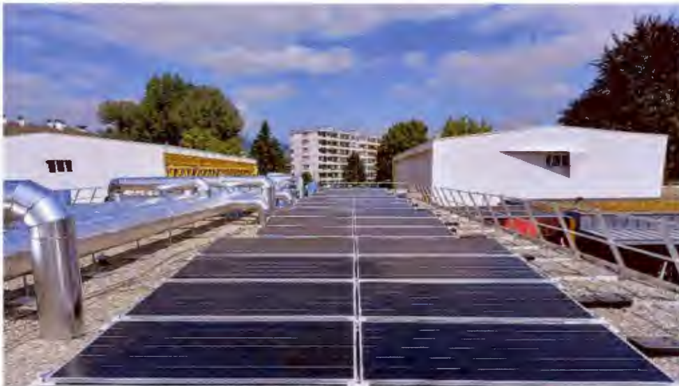
Installation PV de 50kWc en toiture maternelle