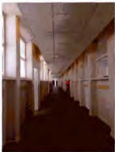
Couloir rénové COTFA