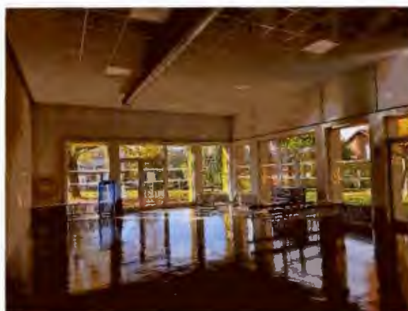
Salle de motricité