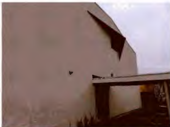
Pignon SUD COTFA 1