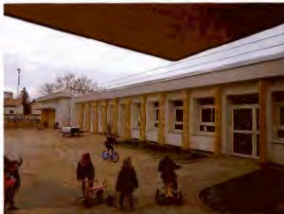
Façade EST Maternelle