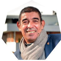
FRANÇOIS ASTORG maire d'Annecy